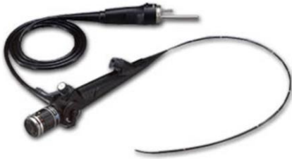
Εικόνα 1: Εύκαμπτο βρογχοσκόπιο

Η βρογχοσκόπηση πραγματοποιείται με ένα ειδικό όργανο που ονομάζεται εύκαμπτο βρογχοσκόπιο και είναι μία σχετικά απλή διαδικασία. Η βρογχοσκόπηση μπορεί να προσφέρει στους θεράποντες γιατρούς πολύτιμες πληροφορίες για την κατάσταση του λάρυγγα, της τραχείας και των βρόγχων του ασθενή. Η εξέταση πραγματοποιείται με την εισαγωγή ενός εύκαμπτου και ευέλικτου εργαλείου στους βρόγχους που κάνει δυνατή την λεπτομερή εξέταση του αναπνευστικού συστήματος. Με αυτή την τεχνική μπορεί να διαπιστωθεί εάν υπάρχει κάποιο εμπόδιο που να προκαλεί βήχα, θόρυβο (συριγμό) ή δύσπνοια. Επίσης, με τη τεχνική αυτή μπορούν να καθαριστούν οι βρόγχοι από πιθανά βύσματα βλέννης ή και να εγχυθούν φάρμακα απαραίτητα για τη θεραπεία του παιδιού. Τέλος, είναι δυνατό να γίνει δειγματοληψία υγρού ή ιστού από τον πνεύμονα ώστε να εξεταστεί για μικρόβια, ουσίες ή άλλες διαταραχές που πιθανόν να ευθύνονται για το αναπνευστικό πρόβλημα του παιδιού.